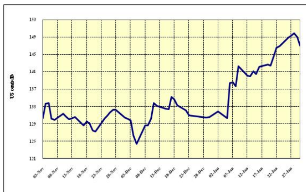
Graphique 4 : Prix indicatifs quotidiens des Brésil et autres naturels 3 novembre 2008 – 30 janvier 2009