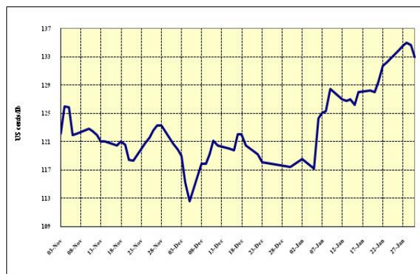
Graphique 5 : Prix indicatifs quotidiens des Robustas 3 novembre 2008 – 30 janvier 2009