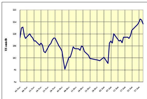
Graphique 4 : Prix indicatifs quotidiens des Brésil et autres naturels 3 novembre 2008 – 30 janvier 2009