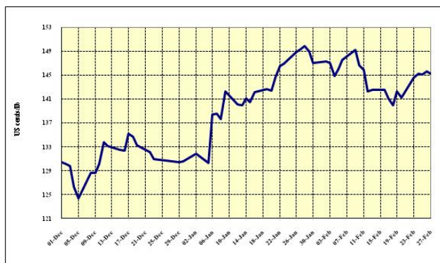
Graphique 2 : Prix indicatifs quotidiens des Doux de Colombie 1 décembre 2008 – 27 février 2009