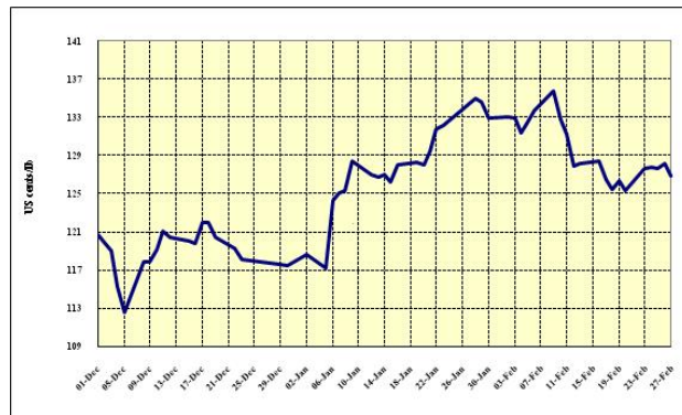
Graphique 3 : Prix indicatifs quotidiens des Autres doux 1 décembre 2008 – 27 février 2009