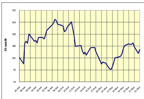
Graphique 4 : Prix indicatifs quotidiens des Brésil et autres naturels 2 janvier – 31 mars 2009