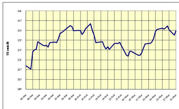
Graphique 3 : Prix indicatifs quotidiens des Autres doux 2 janvier – 31 mars 2009