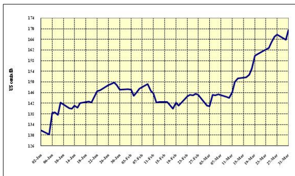
Graphique 2 : Prix indicatifs quotidiens des Doux de Colombie 2 janvier – 31 mars 2009