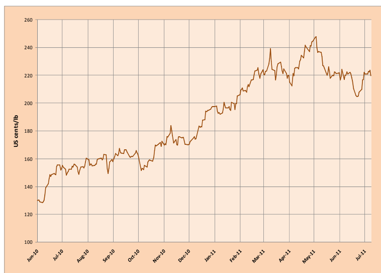
Gráfico 1: Precio indicativo compuesto de la OIC Diario: 1 junio 2010 a 11 julio 2011