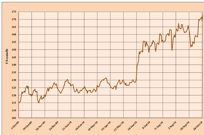
Gráfico 1: Preço indicativo composto diário 1º de outubro de 2009 a 2 de novembro de 2010