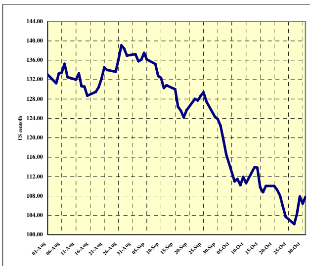
Graphique 4 : Prix indicatifs quotidiens des Brésil et autres naturels 1 août – 31 octobre 2008