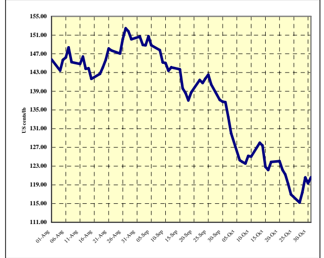
Graphique 3 : Prix indicatifs quotidiens des Autres doux 1 août – 31 octobre 2008