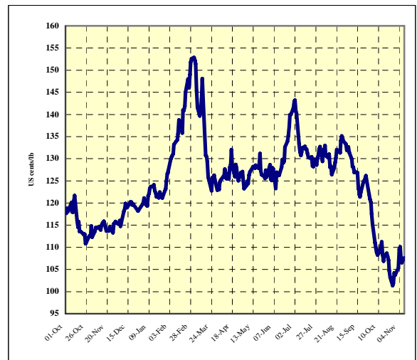
Graphique 1 : Prix indicatif composé quotidien 1 octobre 2007 – 10 novembre 2008

La moyenne mensuelle du prix indicatif composé de l'OIC est passée de 126,69 cents EU la livre en septembre à 108,31 cents en octobre, correspondant à une baisse de 14,5% avec une volatilité accrue (tableau 1). Le graphique 1 donne l'évolution du prix indicatif composé quotidien de l'OIC depuis le 1 octobre 2007 1 . Les graphiques 2 à 5 donnent l'évolution des prix indicatifs quotidiens des quatre groupes de café depuis le 1 août 2008. La baisse a encore été beaucoup plus forte au niveau des prix des Robustas dont la volatilité a également été élevée. Il convient de noter que les ventes des positions sur le marché à terme de Londres (LIFFE) ont augmenté de 36,4%, passant d'un volume équivalent à 23,7 millions de sacs en septembre à 32,4 millions en octobre.