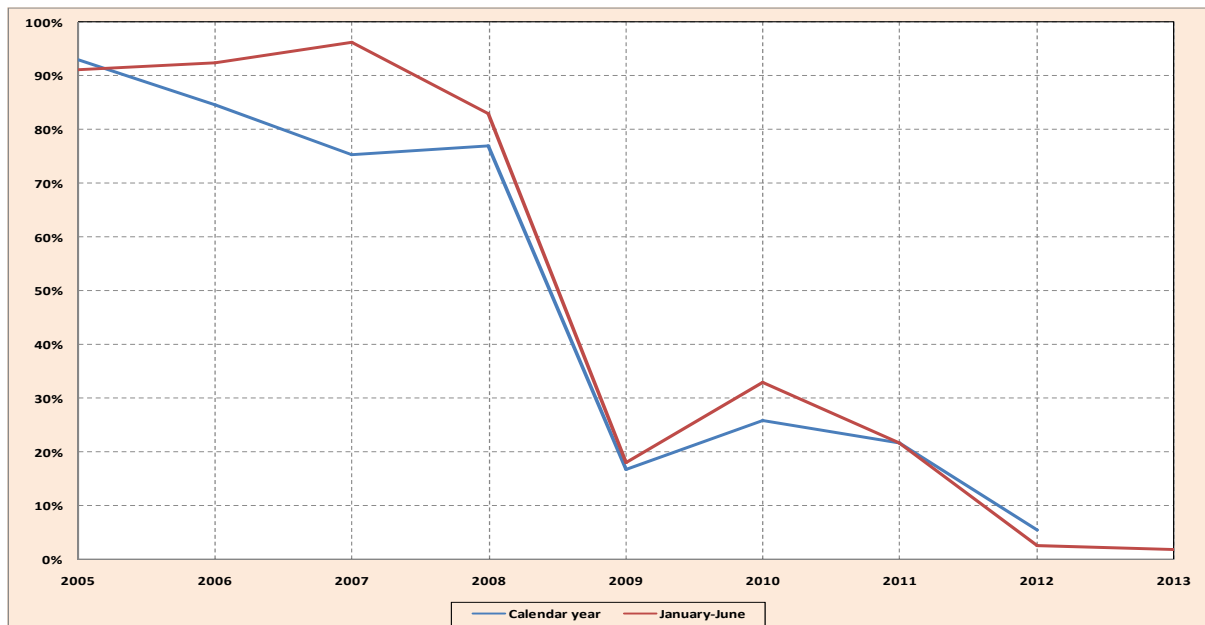
Gráfico 3: Clasificación de NYSE Liffe Porcentaje considerado por debajo de las normas del Programa de Mejora de la Calidad del Café

8. La Organización seguirá observando los resultados de la clasificación de los cafés Arábica y Robusta que se publiquen en los sitios en Internet de ICE y NYSE Liffe.