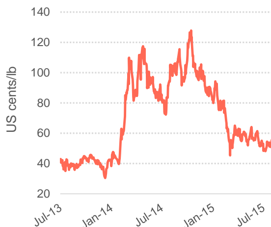
Graphique 3 : Arbitrage entre les marchés à terme de New York et de Londres