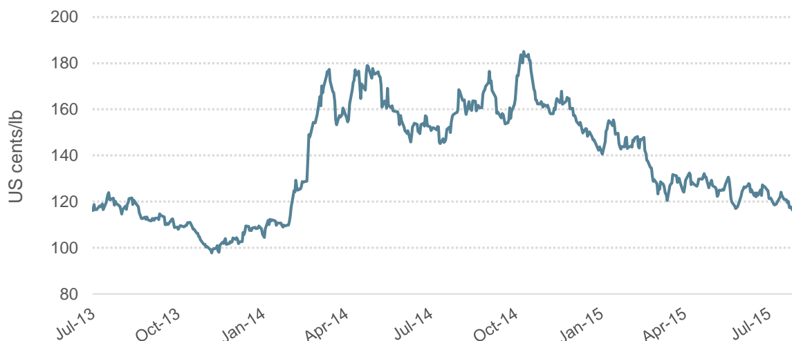
Graphique 1 : Prix indicatif composé quotidien de l'OIC