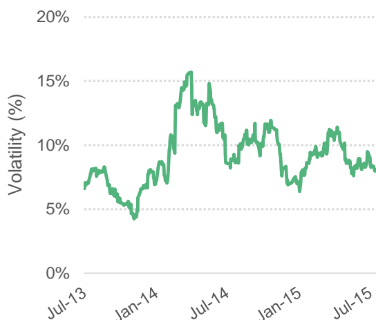
Graphique 4 : Volatilité sur 30 jours du prix indicatif composé de l'OIC

© 2015 International Coffee Organization ( www.ico.org )