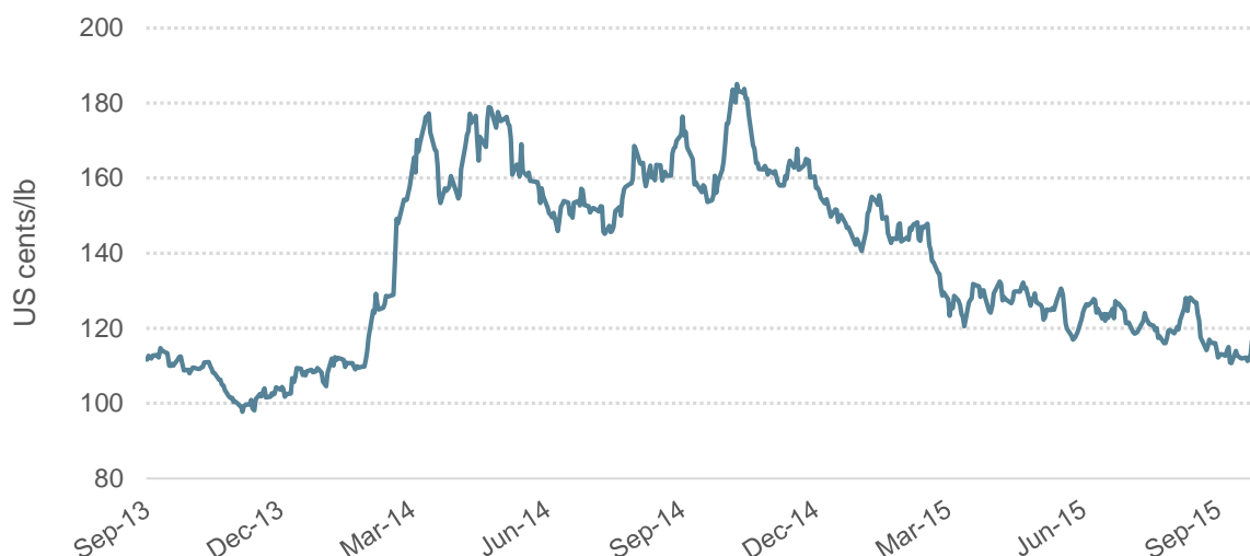
Gráfico 1: Preço indicativo composto diário da OIC