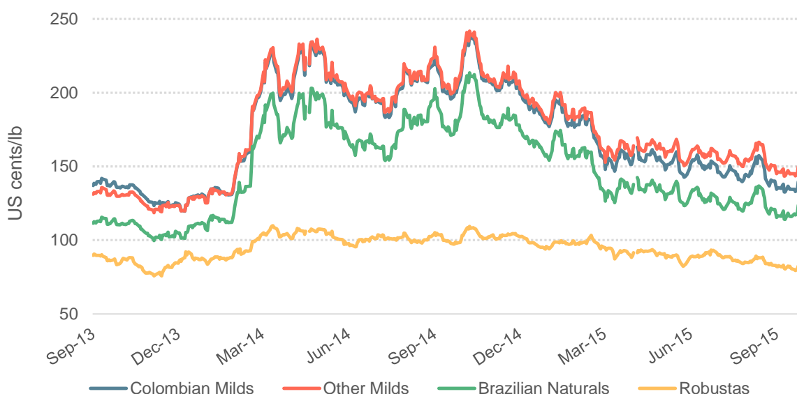
Gráfico 2: Preços indicativos diários dos grupos da OIC

© 2015 International Coffee Organization ( www.ico.org )