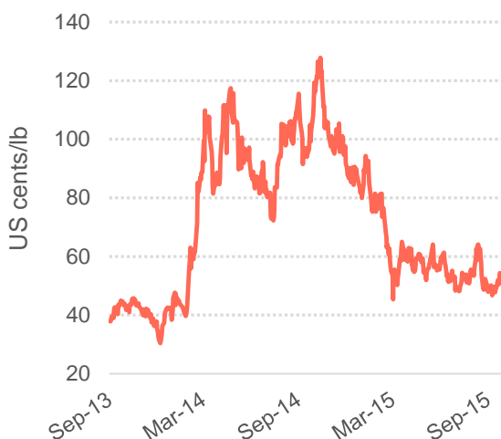
Gráfico 3: Arbitragem entre as bolsas de Nova Iorque e Londres

© 2015 International Coffee Organization ( www.ico.org )