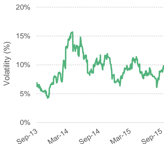
Gráfico 4: Volatilidade da média de 30 dias do preço indicativo composto da OIC